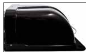
Copertura base di ricarica Cover charging base