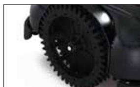
Ruota con sistema di smaltimento erba tagliata Wheel with disposing system of mowed grass

L8 is a concentrate of agile strength. With its special designed central barycentre and cutting edge software, the robot rotates around itself and can handle slopes up to 55% with excellent results even close to the perimeter wire. Tech8 can handle gardens up to 2.200 sqm, and is amazing for exceptional quality of its performance!