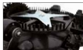
Lama e protezione lama con sistema di filtraggio per smaltimento erba tagliata Protected blade with disposing system of mowed grass