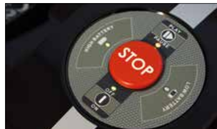
Pulsante Push Stop Push Stop button