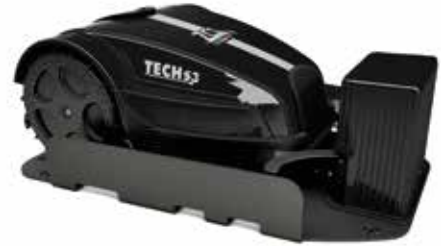
Base di ricarica Charging station