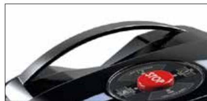
Maniglia di sicurezza con sistema tattile per arresto lama Touch safety handle to stop the blade

Basta con l'installazione! Grazie al sensore ZGS la Tech6 riconosce i limiti dell'area da rasare, senza installazione del filo perimetrale. Ciò significa che una volta acquistato, questo robot potrà essere utilizzato immediatamente. Un sistema di sensoristica avanzata garantisce sicurezza ed affidabilità. Inoltre, grazie alle sue dimensioni ridotte, la macchina riesce a muoversi agilmente anche in spazi molto ristretti. Ideale per superfici fino a 200 m 2 , con pendenze fino al 50%.