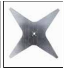
Lama 4 punte da 25 cm 4 point star blade